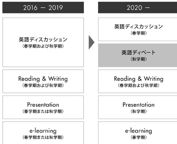
図1. 2020年度以降の1年次英語必修科目カリキュラム（立教大学HPより抜粋）

「英語の立教」と称されてきた立教大学では、2010年に1クラス8名程度という少人数で行う「英語ディスカッション」を全学部1年次必修とするなど、これまでも他大学に先駆けて先端的かつ特色ある英語教育を展開してきました。2020年度より、外国語教育研究センターを中心に、それをさらに発展させ、新しい1年次英語必修カリキュラムをスタートさせます。具体的には、英語ディスカッションクラスの授業内容をこれまでの1年から半年に集約し、秋学期に英語ディベートクラスを新たに設けます（図1参照）。